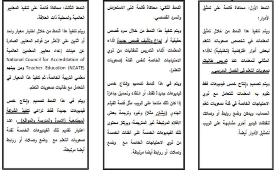
شكل (2): أنماط المحاكاة الإلكترونية الثلاثة