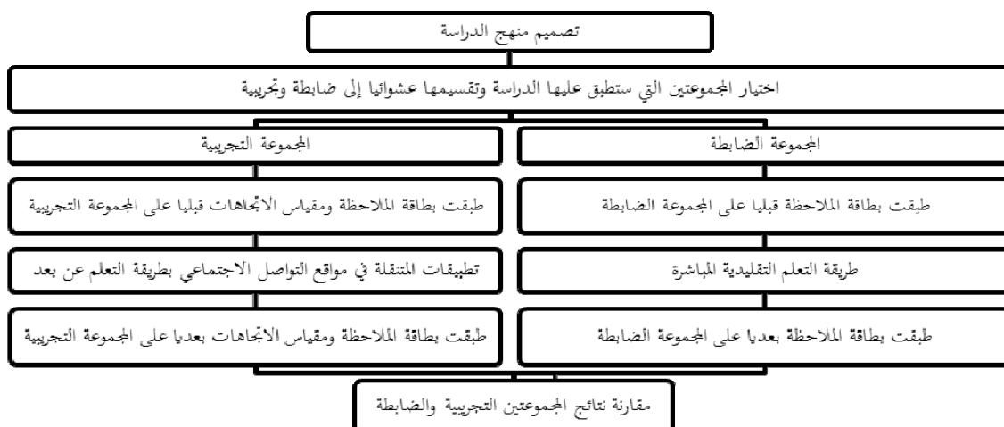
شكل رقم 1: تصميم منهج الدراسة

التغابن) باستخدام تطبيقات الهاتف النقال في مواقع التواصل الاجتماعي، بينما تتلقى المجموعة الضابطة تدريجياً باستخدام طريقة التعلم التقليدي الذي يتطلب وجود معلمة المقرر داخل القاعة الدراسية وتدرس المقرر وجهاً لوجه ودون استخدام أي من تطبيقات الهاتف النقال، بحيث يتم التمهيد للآيات المقررة بمقدمة وتعريفهم بموضوع السورة وموضوعاتها بما لا يتجاوز 5 دقائق، ثم توجيه الطالبات بفتح المصحف الشريف وحثهن على الاستماع والانصات، يعقبها تلاوة نموذجية فردية للمعلمة تستمع لها الطالبات